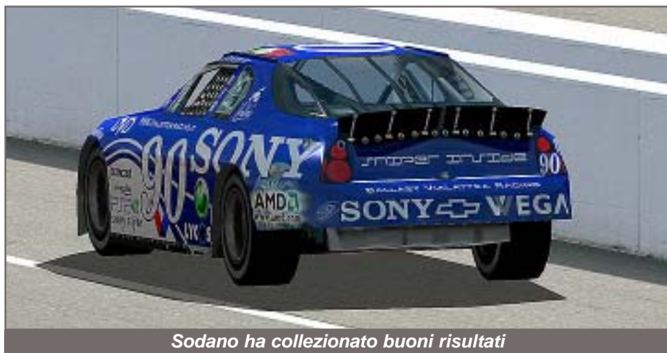
Sodano ha collezionato buoni risultati