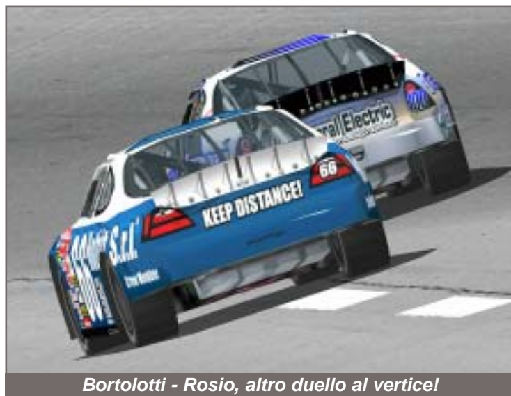
Bortolotti - Rosio, altro duello al vertice!

A. Zanetti 7,5: Prendendo in considerazione le ultime quattro gare, rimane fuori la sua grande vittoria di Talladega,