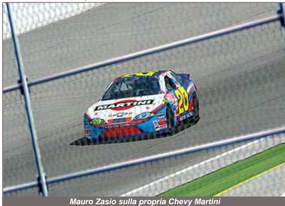
Mauro Zasio sulla propria Chevy Martini

D. Forneris 9: Un continuo crescendo di prestazioni che culminano nei due primi posti nelle ultime gare lo proiettano a puntare alla categoria superiore.