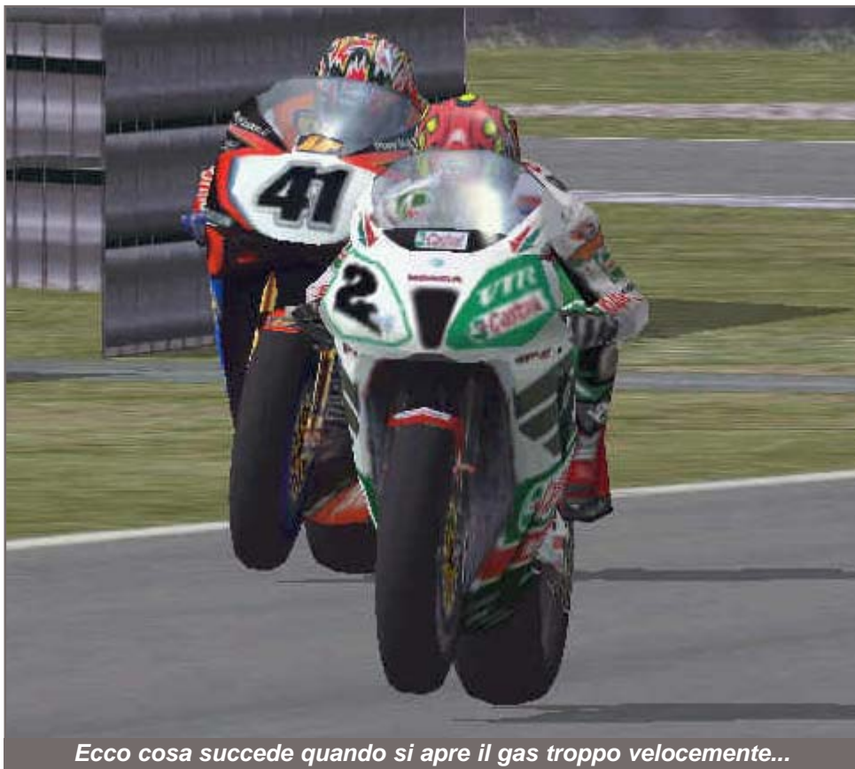
Ecco cosa succede quando si apre il gas troppo velocemente...