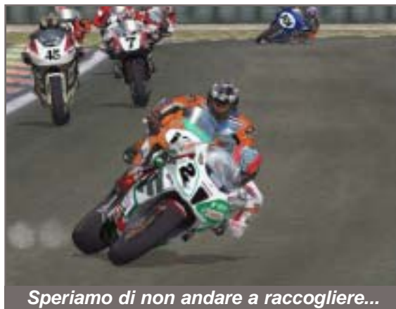
Speriamo di non andare a raccogliere...

che macinare km gli farà bene e che il prossimo anno dovrò girarmi sempre meno e aprire il gas cercando sorpassi