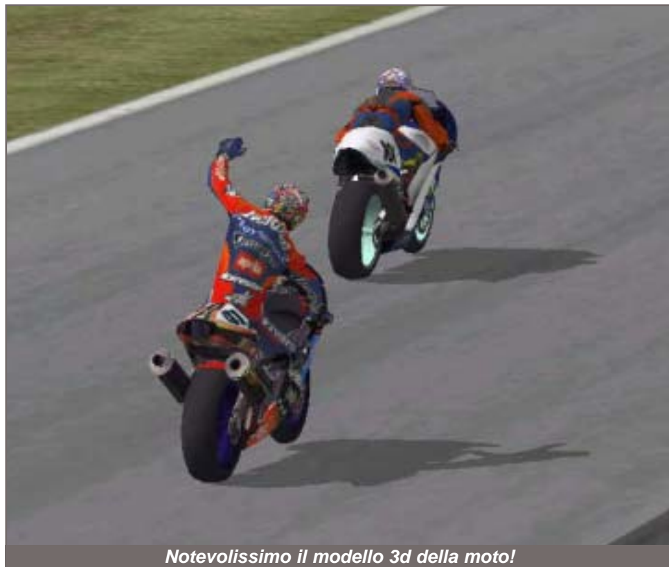
Notevolissimo il modello 3d della moto!

Webmaster del campionato, velocissimo ma incostante, ha uno stile di guida inconfondibile, caratterizzato da una