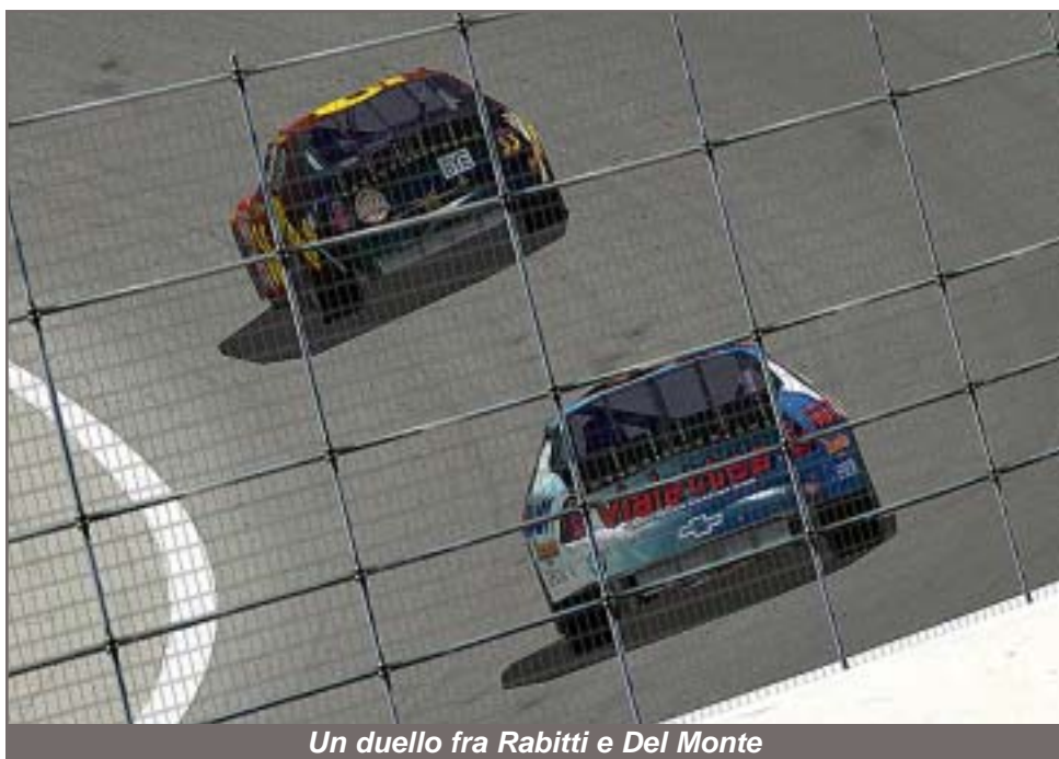
Un duello fra Rabitti e Del Monte