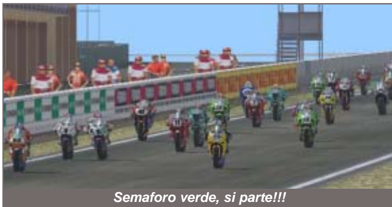
Semaforo verde, si parte!!!

Una delle stelle nascenti del campionato, l'ho sfidato varie volte e posso sinceramente dire che il talento c'è,