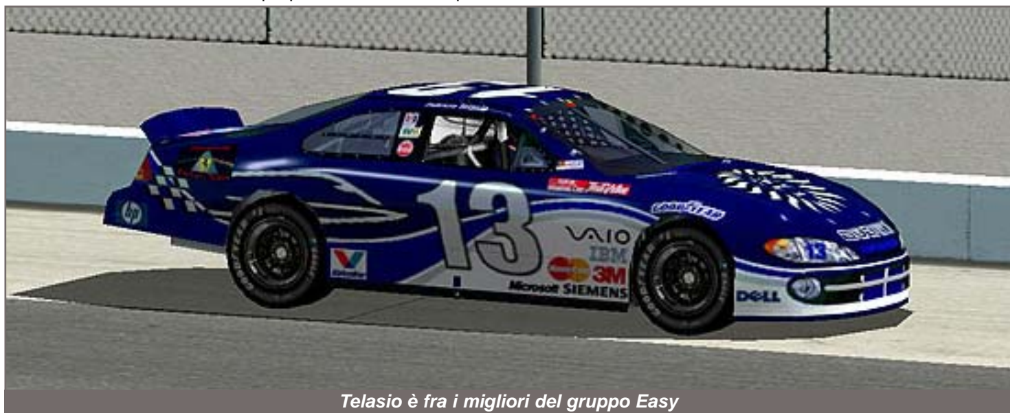
Telasio è fra i migliori del gruppo Easy

F. Gigliotti 6,5: Corre tre gare collezionando un quarto posto a Talladega e due decimi tra Texas e Richmond. Rischia la vittoria a Talladega ma viene tradito dall'emozione. All'ultimo restart anzichè partire pulito si rende corresponsabile di un incidente che lo mette fuori dai