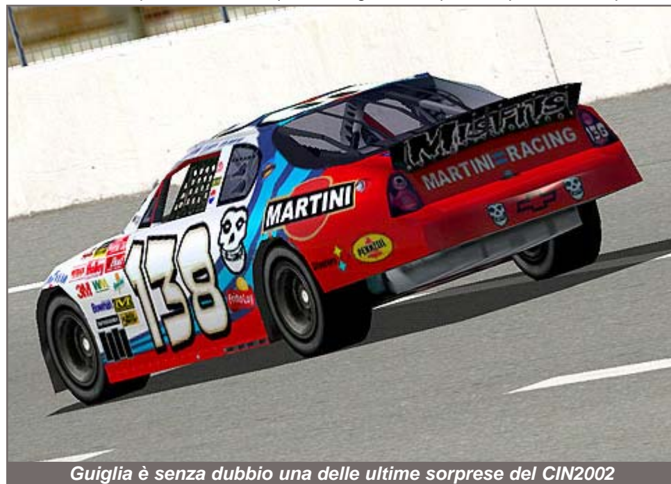
Guiglia è senza dubbio una delle ultime sorprese del CIN2002

ce ne eravamo accorti dal tempo del NOC. Non riesce proprio a lasciare questa serie, è sempre là tra i primi 5 con qualche salita pure sul podio. Infatti appena il suo patentino sale