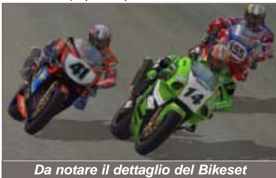
Da notare il dettaglio del Bikeset