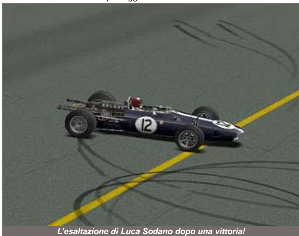
L'esaltazione di Luca Sodano dopo una vittoria!