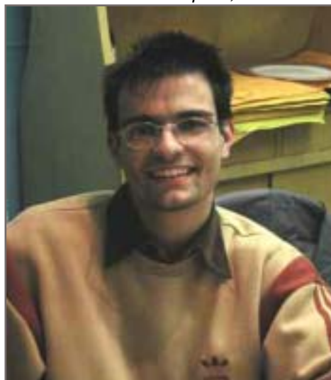
Eccomi in tutto il mio splendore...