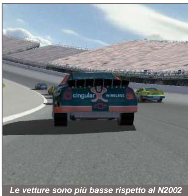
Le vetture sono più basse rispetto al N2002

questo riusciamo a compiere manovre al limite senza tanti sforzi. Si sente che la macchina non corre sui binari ma a differenza di N2002 questo non ci costringe a piangere quando sbagliamo una traiet-