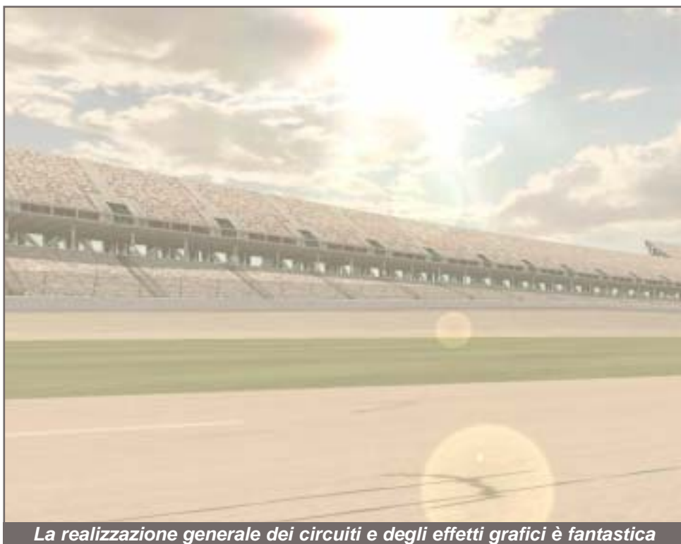
La realizzazione generale dei circuiti e degli effetti grafici è fantastica

gioco nuovo. Non rappresenta il salto che ci fu con l'uscita di Nascar4, ma Nascar4 rappresentò la nuova generazione per i simulatori Papyrus. Ora abbiamo questo Nascar 2003 che, a prima vista e solo alla vista, può anche sembrare un semplice upgrade grafico del precedente. Ma invece toccando con mano il tutto vediamo che la fisica che controlla il comportamento delle vetture sembra fare miracoli. Il comportamento delle auto è molto realistico. A regola non avrei le basi per poter affermare ciò, non ho mai guidato una stock car però, da quello che ho p o t u t o