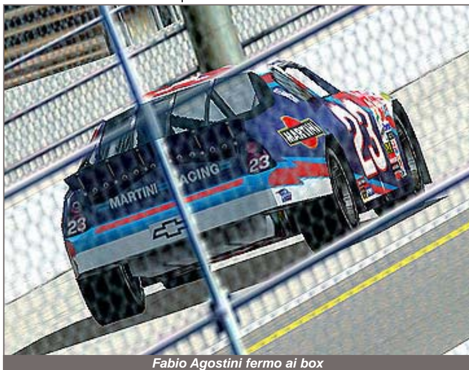
Fabio Agostini fermo ai box