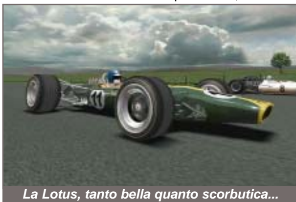
La Lotus, tanto bella quanto scorbutica...