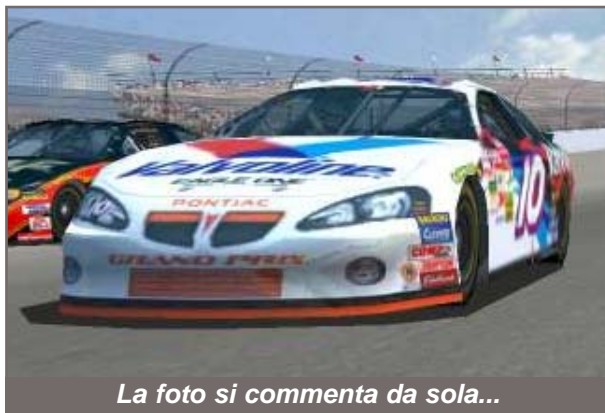
La foto si commenta da sola...

ricepire dalle gare viste in televisione, mi sento di affermare con fermezza che questa volta ci siamo. Questa volta la Papyrus ci vuole lasciare un buon ricordo di lei, anzi, il definitivo ricordo. Riuscire a creare un setup per essere