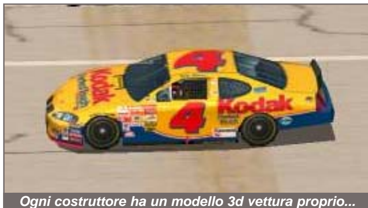
Ogni costruttore ha un modello 3d vettura proprio...

La mia prima impressione su Nascar 2003 è stata molto positiva. Tralasciando la nuova grafica di fondo