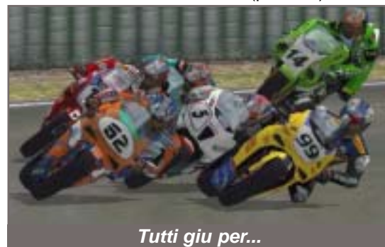
Tutti giu per...

in 6, col Superbike 2001, anche con connessioni stellari, è impossibile giocare in più di tre: pensi valga ancora la