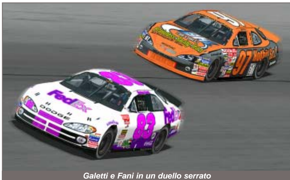
Galetti e Fani in un duello serrato