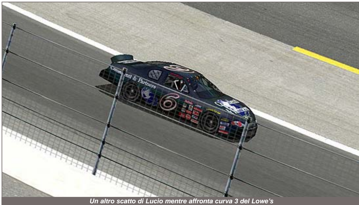
Un altro scatto di Lucio mentre affronta curva 3 del Lowe's