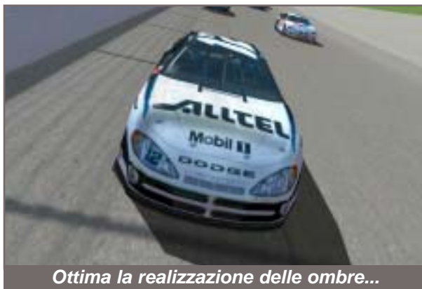
Ottima la realizzazione delle ombre...

Cosa tanto attesa era anche l'utilizzo di modelli 3D differenziati per le 4 vetture. Le ho esaminate una ad una e vi posso garantire che sono veramente 4 modelli diversi. Ford e Dodge si differenziano per pochi particolari, un po' come Chevy e Pontiac, che risultano molto grintose grazie al loro muso allungato. Stavolta la pace car è un fantasma, quindi non ci sarà più il problema della pace car che devasta le auto che incontra. Ora, semplicemente, ci passerà attraverso come il migliore