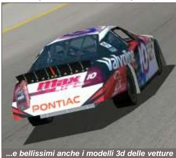
...e bellissimi anche i modelli 3d delle vetture

Comunque rimane tutto quasi inalterato. Nel menù grafico appaiono molte nuove chicche che riguardano gli effetti luce e la mappatura delle ombre in