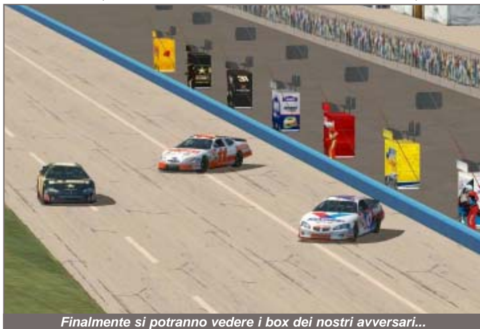
Finalmente si potranno vedere i box dei nostri avversari...