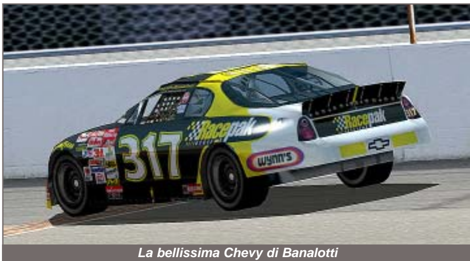
La bellissima Chevy di Banalotti