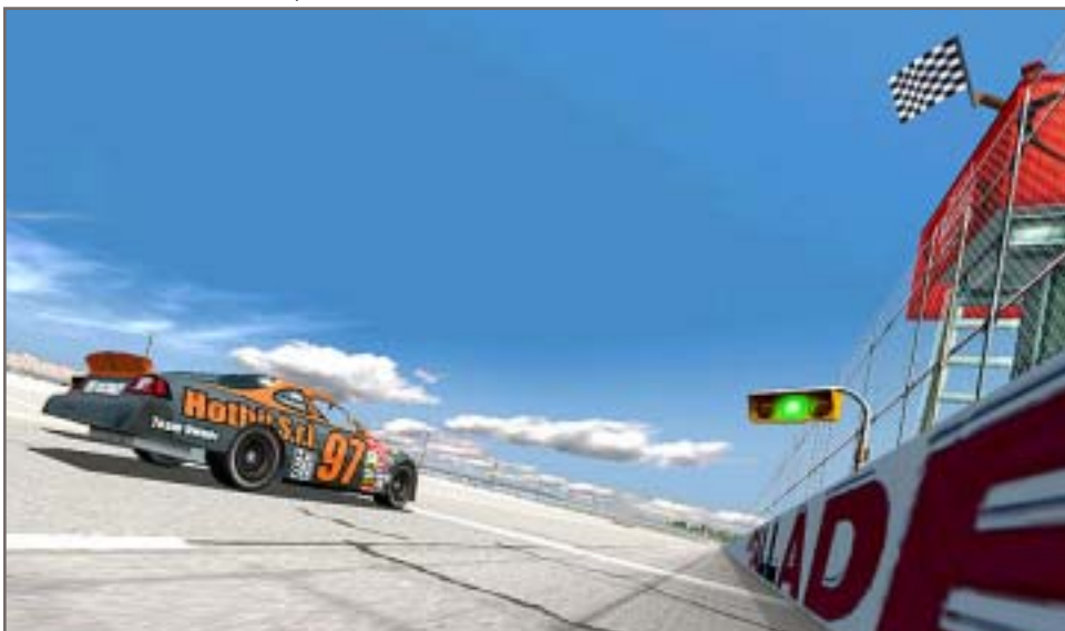
Fani taglia il traguardo di Talladega durante una sessione di test

per l'intervista e ovviamente per il tempo che dedica al Nascar Magazine Online.